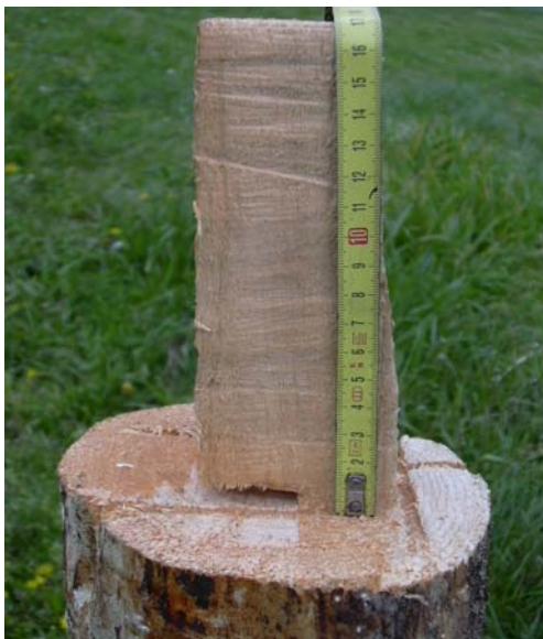
Fig.8: Incorrecto Pieza menor de 20 cm. Corte superior a 1/3 del ancho