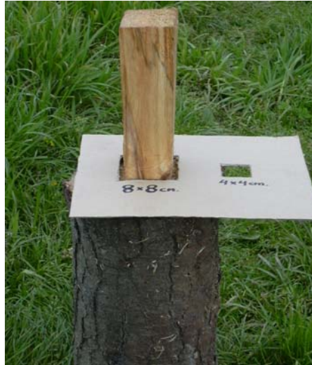
Fig.7: Detalle correcto de la figura a realizar.