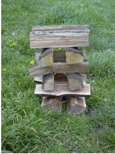
Fig. 11: Detalle del "castillo de leña" que concluirá la prueba.