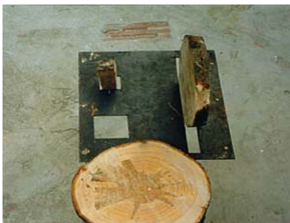
Fig. 3.- INCORRECTO Rodaja Superior a 2,5 cm