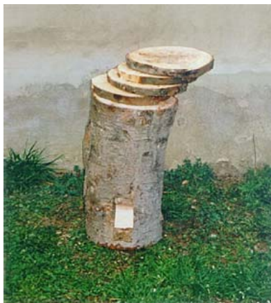
Fig. 1: detalle del cuadradillo y las rodajas