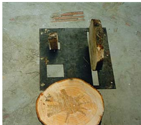
Fig. 2: Incorrecto si el cuadradillo y la rodaja no pasa por la plantilla