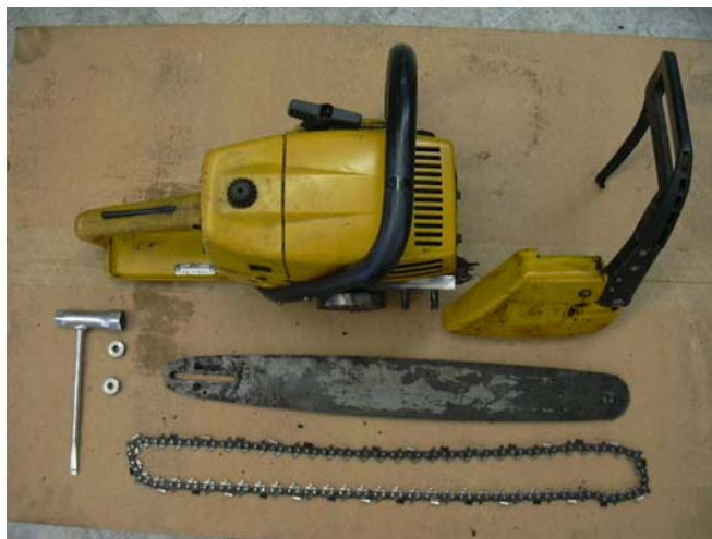
Fig.5: Detalle de la máquina en posición de partida

considere que la máquina está perfectamente montada, con la cadena y los tornillos bien ajustados procederá a arrancarla; “Motosierra en el suelo, el pie derecho sobre la manija delantera y se tira con la mano derecha” y comenzará el circuito en el sentido señalado y siguiendo las siguientes pruebas.