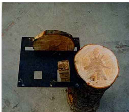
Fig. 4.- CORRECTO Rodaja inferior a 2,5 cm