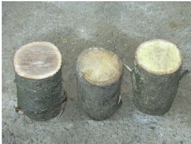
Fig. 10: Detalle de las trozas a partir.